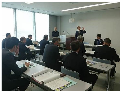
四日市港管理組合で 港湾施策等の説明を聞く参加者

開 催 日 平成28年11月15日～11月17日 視 察 先 四日市港・三河港視察会 参 加 者 12名 備 考 ・四日市港管理組合を訪問し、コンテナ ターミナルやポートビルなどを視察 ・三河港振興会を訪問し、コンテナター ミナルや国際自動車港などを視察